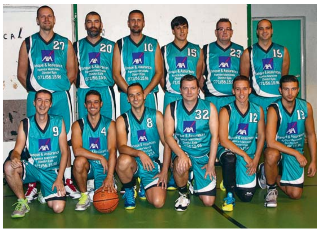
Une équipe au top, avec l'apport de quelques « gamins ». ■ COMM