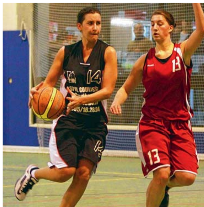
Les Courcelloises cherchent le bon rythme. ■ AA